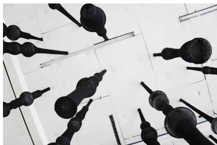
Uten tittel 1 (detalj)

Begge skulpturene er laget av generiske materialer som finnes over alt rundt oss og som kan kjøpes hvor som helst. Det